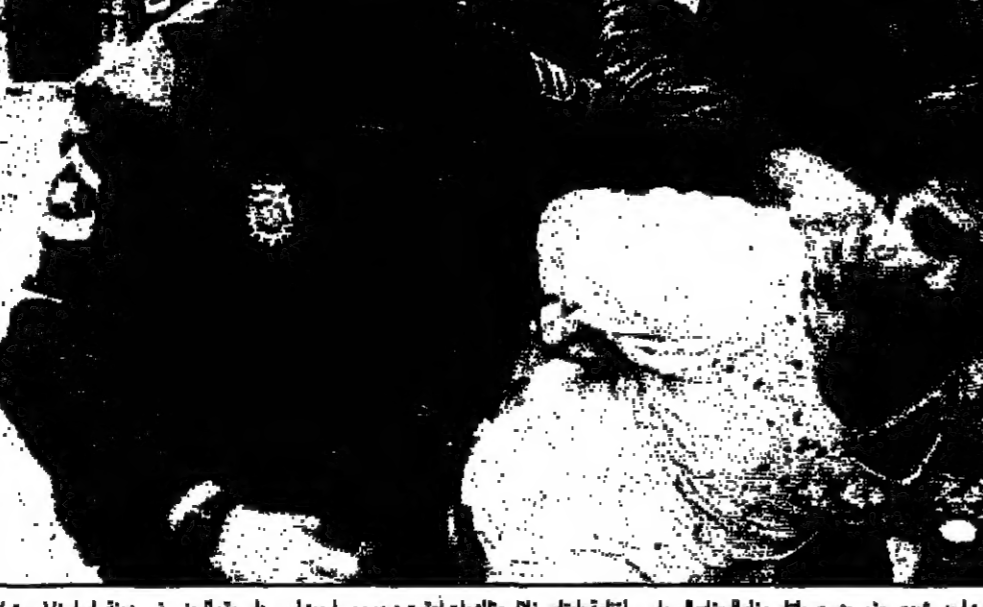
المرء من الحركة الاسلامية يلقون بظهور حزب ديني يقاسمه الجناح السياسي لرايتا، عقب خطف وقتل عضو في الحزب الحاكم في يامبوتو (روسيا)

نيروبي - ورجع زعيم اربعة ايام من المحادثات بين زعماء الفصائل القبرصية اليونانية والتركية في سويسرا.